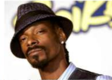
14. Artiestennaam ?