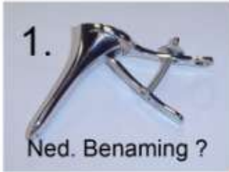
1. Ned. Benaming ?