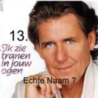
13. Echte Naam ?