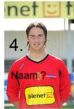
4. Naam ?