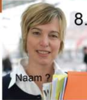
8. Naam ?