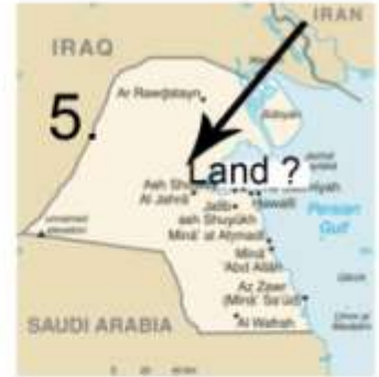
5. Land ?