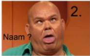
2. Naam ?