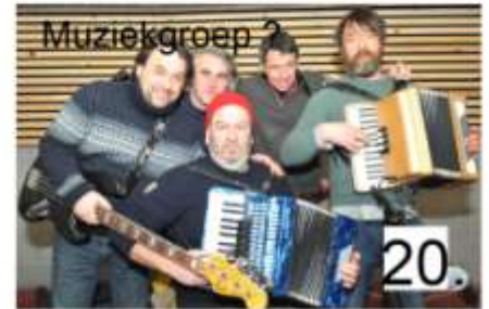
20. Muziekgroep ?