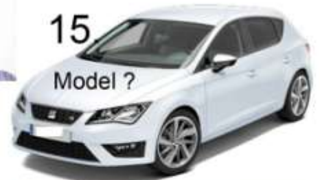
15. Model ?