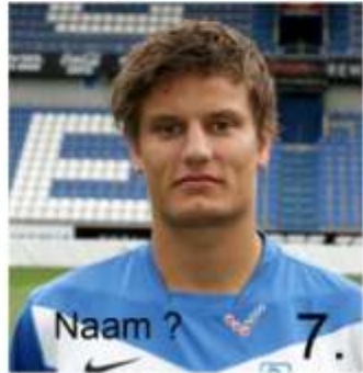
7. Naam ?