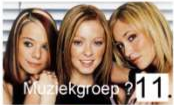
11. Muziekgroep ?