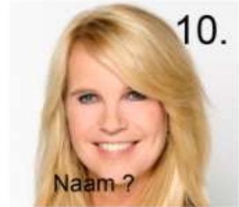
10. Naam ?