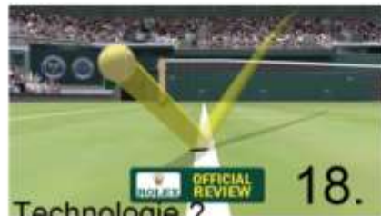
18. Technologie ?