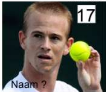
17. Naam ?