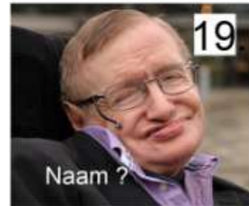
19. Naam ?