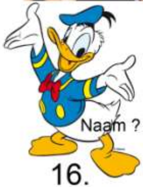
16. Naam ?