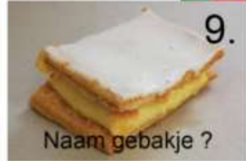
9. Naam gebakje ?