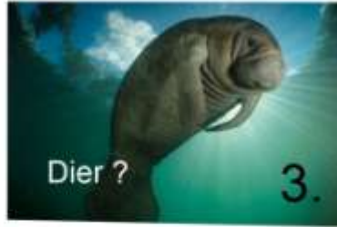
3. Dier ?