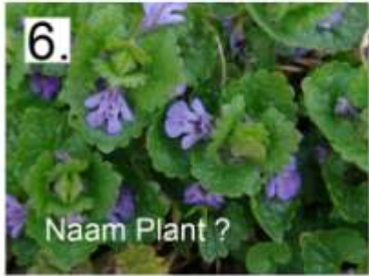
6. Naam Plant ?