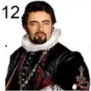
12. TV reeks ?